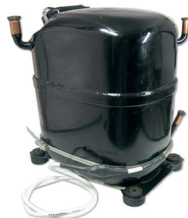
Collier chauffant FCHK monté sur un compresseur

Partie chauffante avec tresse métallique